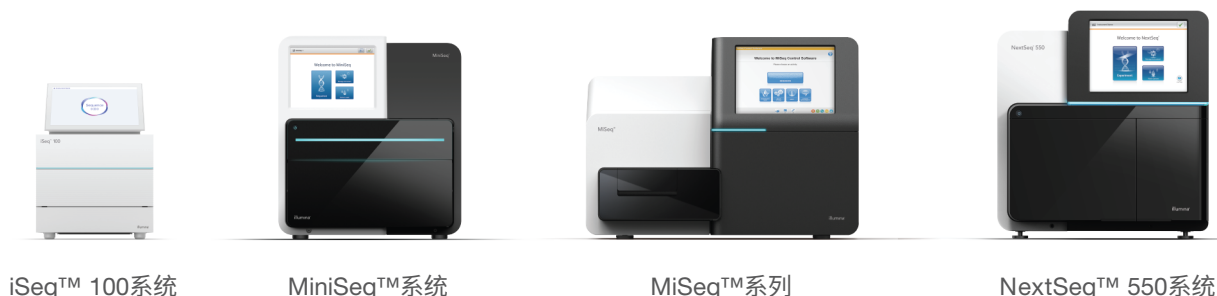
图 3 :NGS 测序系统产品系列 - Illumina NGS 系统为多种应用、样本类型和通量需求提供解决方案。每个平台都可以提供高度准确的数据、灵活的通量和简单流畅的工作流程。