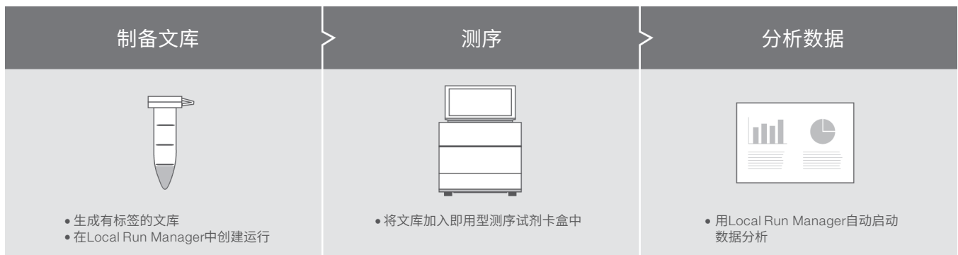
图 2 :iSeq 100 系统工作流程 - iSeq 100 系统是从 DNA 样本到数据的一体化工作流程的一部分。

iSeq 100 系统是一个一体化三步工作流程的一部分, 该工作流程包括文库制备、测序和数据分析 (图 2)。